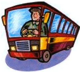
chofer de autobús bus driver