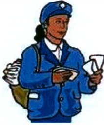
cartero letter carrier