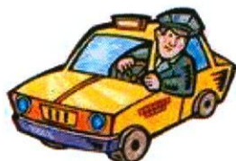
chofer de taxi taxi driver